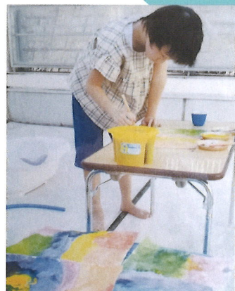
創作のはじまりの場所、親子教室にて。

料理と読書、そしてアートが好きなの13歳です。女の子の素敵なドレスをデザインしたり、貼り絵をしたり、色々な工作をしたりしますが、一番ハマっているのは、今回の企画展で発表する切り絵です。