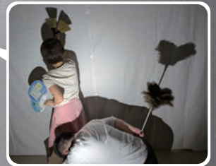
裏側はこんな感じです！

2007年 Performing Arts Mess in Osaka 準グランプリ受賞 2014年 福山大道芸 STREET 賞受賞