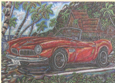
湯井 亮(片山工房|兵庫) 「リロ&スティッチ・ハワイ・カウアイ島 ホットウィールBMW507ロートスター」 素材: アルコールマーカー、紙

様々な時代や場所で生み出されているアート作品。その中には、作家の想いや考えだけでなく、その人となりまでも垣間見えるような、ある種の生々しさをもった作品があります。突き詰められた豊かな表現には、鑑賞者を想像の世界にいざない、みる人の世界観を拡張する力があります。今回のエイブル・アート展では、そんな5人のアーティストの作品をご紹介します。